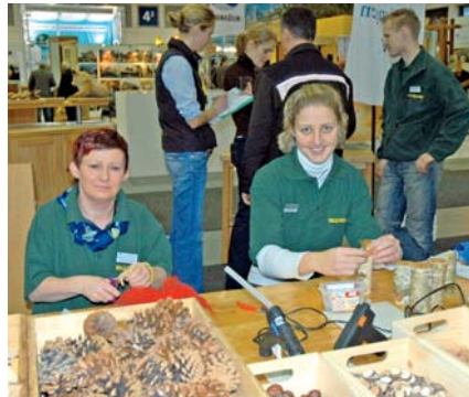
Basteln mit Naturmaterialien

Zum ersten Mal bezog das Wald-Solar-Heim Eberswalde in Gemeinschaft mit dem Amt für Forstwirtschaft Eberswalde während der Internationalen Grünen Woche neues Terrain bei Multitalent Holz und war begeistert.