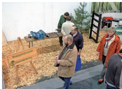
In der „Multitalent Holz“-Halle bot die WAS Kunsterspring Motorsägen-Kurse an

Das Bundesministerium für Ernährung, Landwirtschaft und Verbraucherschutz (BMVEL) vereinbarte Vorführungen unseres modernen Harvestersimulators im Rahmen ihrer Sonderschau „Nachwachsende Rohstoffe“ in Halle 23 a. Die Vorführungen des Simulators waren im Stundentakt von ca. 100 Besuchern sehr gut angenommen.